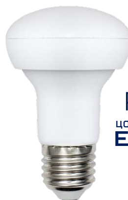
R63 цоколь E27