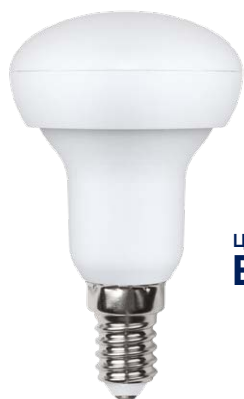
R50 цоколь E14