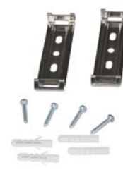
Монтажные клипсы в комплекте!