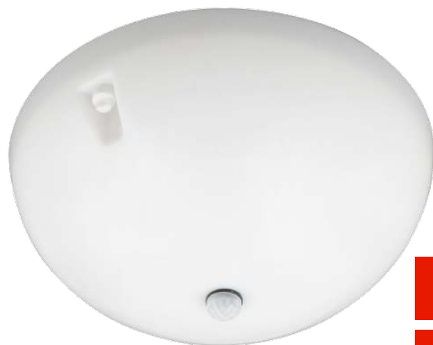
ULW-K20B/ULW-K20D/ULW-K20F с датчиком движения

Светильники светодиодные влагозащищенные антивандальные серии ULW-K20 предназначены для внутреннего освещения помещений ЖКХ, общественных и административных зданий и сооружений, вспомогательных помещений жилых домов (подъездов, холлов, подвалов и т. п.), подсобных и складских помещений, коридоров, входных групп и лестничных пролётов. Изготавливаются в исполнении УХЛ 1.