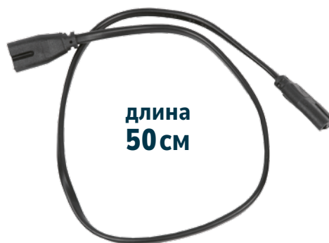
UCX-Q851 LL/015 BLACK